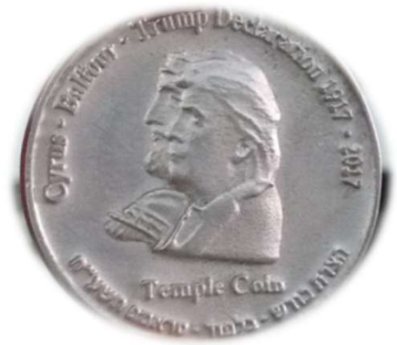
halber Schekel private Prägung 2018 zur Ehre Trumps limitiert auf 1000 Stk.